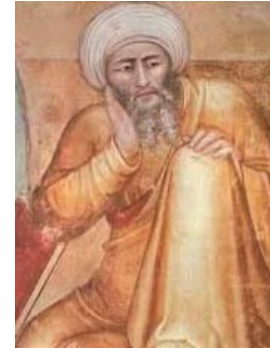
Ibn Rushd (Averroës)

Totalt sett har den följande vetenskapshistorien och kulturhistorien efterlämnat ett enormt arv som grundlagts och hämtats från österns lärde. Behöver jag nämna al-Khwarizmi och hans algoritmer? Eller Averroës (Ibn-Rushd) i Andalusien, där Toledo lär ha haft mer än 70 bibliotek, som förmedlare av Aristoteles texter till tillskyndande nordeuropeiska lärde? Eller Ulug Beks astronomiska observationer och tabeller upprättade med hjälp av en jättelik sextant i det väldiga observatoriet i Samarkand och samlade i Zij-i-Sultan-i Gurkani ? Hans arbeten tog vägen över Konstantinopel och fick sedan stor betydelse för Europas astronomer. Eller den likaså i Samarkand verksamme Avicenna (Ibn-Sina) vars böcker i medicinämnet blev kurslitteratur på många europeiska universitet under 400 år. Har ni ett kvitto på er är det resultatet av en uppfinning i österns handelskultur.