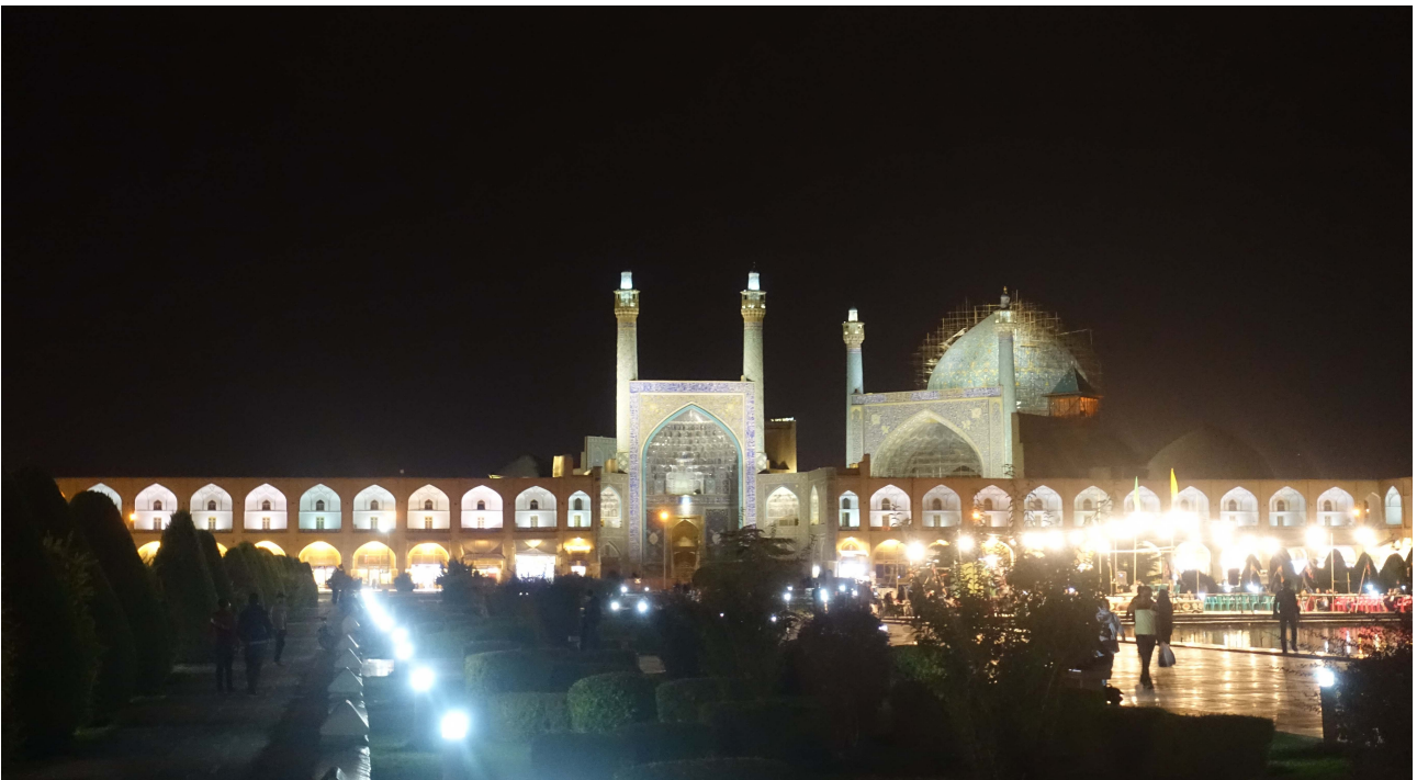
Del av torget i Esfahan, Naqsh-e Jahan, med Masjed-e Shah

förhandlade - i varje fall inledningsvis - ner sina anspråk så att den royalty per oljefat man betalade till Kuwait och Saudiarabien i vissa områden blev dubbelt så hög som den gängse vid de äldre avtalen. På detta sätt säkrade man oljetillgångar för den snabbt stigande bilmängden och de industriella oljebehoven i USA samtidigt som man sannolikt slapp en mängd problem med diverse begynnande nationaliseringskrav i Mellanöstern. Det senare innebar också att den sovjetiska propagandan i området bet sämre. Det amerikanska finansdepartementet fick 1949 in 43 miljoner dollar från Aramco (American Arabian Oil Company) och sauderna 39 miljoner dollar. Efter omförhandlingar med ändrade skattelättnader betalade bolaget 1951 6 miljoner dollar till USA medan sauderna tillfördes 110 miljoner dollar. I Iran var Anglo-Iranians intressen svåra att skilja från Storbritanniens precis som det varit för det gamla Ostindiska kompaniet. Vreden mot engelsmännen skruvades upp allt mer när de gigantiska summorna från bolagets vinst jämfördes med jämförelsevis små iranska royalties. Lokala investeringar i Iran var blygsamma. Staden Abadan, hemvist för världens största raffinaderi kunde bara ge hälften av sina 25 000 barn skolgång 1950 och hela Abadan fick inte mer elektricitet än vad en enda gata i London konsumerade. Stelbentheten i det brittiska kolonialmedvetandet var iögonfallande medan världen förändrades.