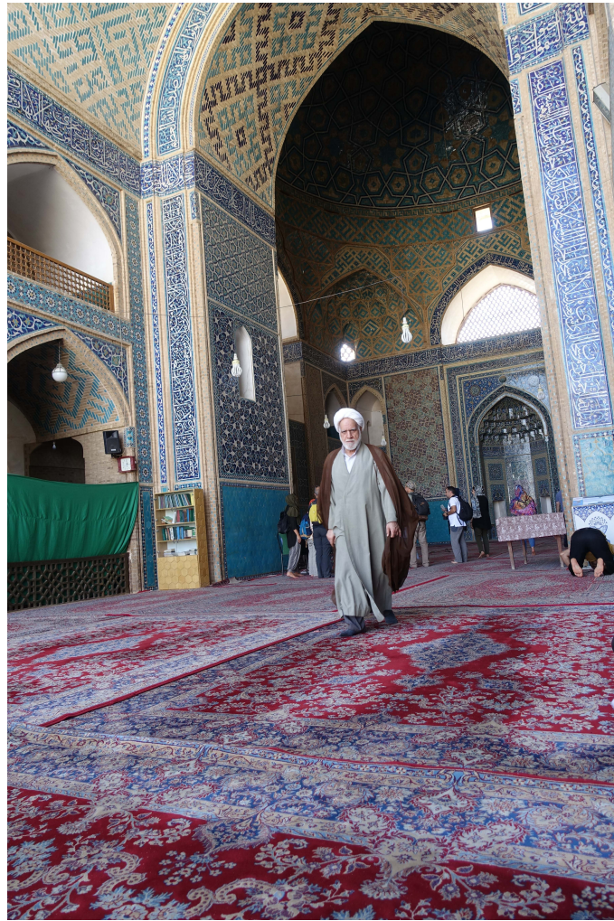
Imamen efter bönetimmen, Masjid-e-Jameh, Yazd, Iran. Oktober 2018

Det finns i storleksordningen 1,8 miljarder människor i världen som ser sig som muslimer. Generellt har de islamska föreställningarna en stark närvaro hos majoriteten av människor i samhällen där islam dominerar. Det behövs bara några ögonblick på en gata i Mellanöstern för att övertyga sig om detta. Därför blir det också nödvändigt att även ta till sig dessa föreställningsvärldar för att förstå något av Mellanösterns dynamik och förutsättningar. Att sedan också ett mer materialistiskt synsätt kan bli en del av förståelsen är en annan sak.