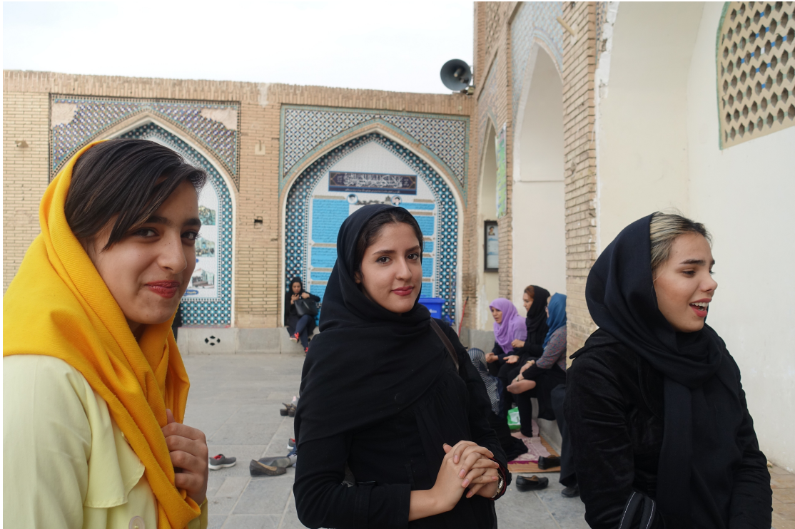
På ett litet undanskymt torg i Esfahan, Iran. Notera hur huvudduken glidit bakåt över flickornas hår, ett sätt att tänja på gränserna.

fattigdom. Det den lätt igenkände västerländske resande turisten i Mellanöstern möter är oerhörda mängder av människor med skyggt intresserade blickar som ibland är mörka men mest nyfikna och vetgiriga eller undrande. Det hörs ett ständigt återkommande "Hello", "How are you", "What's your name", "Welcome to Iran" eller var du nu råkar befinna dig. Tyvärr tar samtalet ofta slut där eftersom språkkunskaperna ömsesidigt är begränsade. Att bli hembjuden till en familj är inte heller ovanligt. Det som kanske är svårast är ofta kontakt och samtal med kvinnor om du är man. Att som man försöka hälsa på en kvinna genom att sträcka fram sin hand är oftast ingen bra idé. Det känns sorgligt eftersom kvinnorna förmodligen är bärare av den viktigaste bilden av situationen.