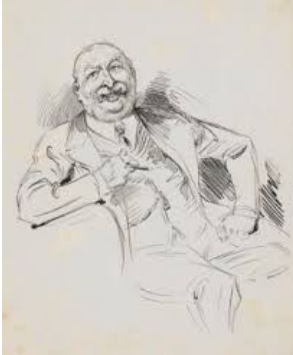
William Knox D'Arcy