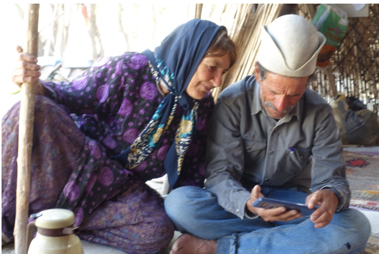
I tältet hos en qashqai-familj i Zagrosbergen i södra Iran. Mor och far studerar bild på vår sommarstuga.