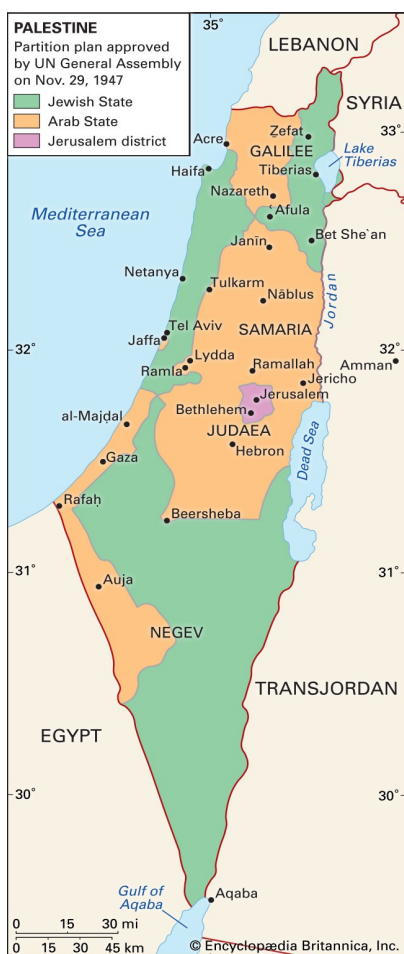
FN:s delningsplan 1947