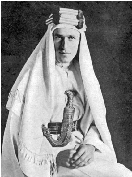
T E Lawrence

mot osmanerna vilket dock avvisades av britterna inledningsvis. Men britternas inställning kom att ändras kort därefter.