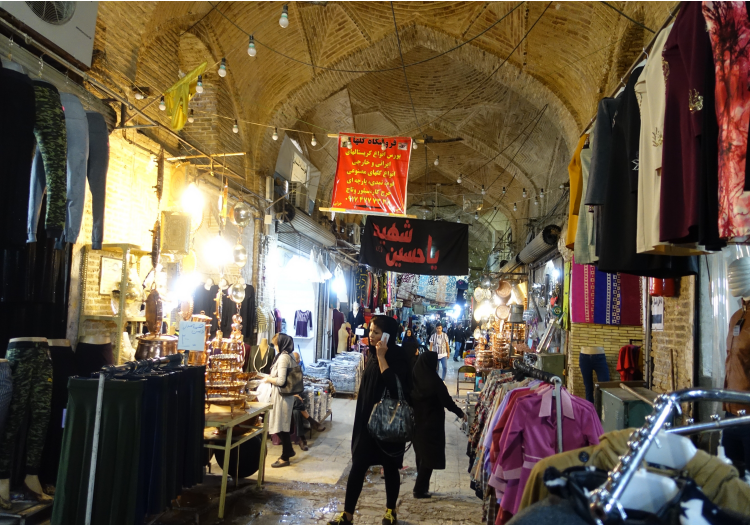
Bazaar-e Vakil, Shiraz