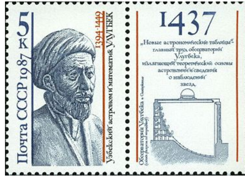
Ulug Beg och en sektion av hans observatorium på sovjetiskt frimärke