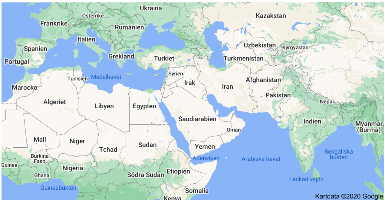
Översiktskarta Mellanöstern och Centralasien med omgivande länder. Långt ifrån alla länder är namngivna p g a platsbrist.

Det finns förstås anledning att fråga sig dels vilket område som avses med ”Mellanöstern” och dessutom varför jag stavar med stort M i denna text. Området som avses är – får jag erkänna - något löst i kanten. Kärnområdet i benämningen av territoriet är tvåflodslandet, dvs den bördiga marken mellan floderna Eufkrat och Tigris och områdena norr och söder därom och omfattar även dagens Syrien, länderna på arabiska halvön, Jordanien, Palestina och Irak. Jag inkluderar här också nuvarande Egypten, Turkiet, Iran och Afghanistan. Man skulle också kunna tänka sig områdena längre norrut som Kaukasusområdet och Turkmenistan med hänvisning till historia och kultursammanhang. Även de flesta nordafrikanska länder skulle kunna räknas in. Stavningen med stort M har förstås en utgångspunkt som är eurocentrisk men det är svårt att hitta ett mer neutralt uttryck som på motsvarande sätt snabbt fångar in en motsvarande del av världen. Så – för min del – låt gå för Mellanöstern av historiska skäl och att det stora M:et gör uttrycket till ett egennamn.