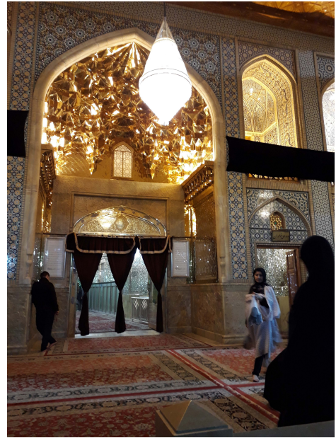
Aramgah-e Shah-e Cheragh, Esfahan, imamen Ahmeds gravhelgedom

Stormakterna använde sig gärna av lokala härskare för att kunna styra i önskade riktningar och i Irans fall av shahen Reza Pahlavi. Sedan länge utspelades en dragkamp mellan Mohammad Mosaddeqs National Front Party och shahen. Valet 1949 till det iranska parlamentet Majlis handlade främst om hur Iran skulle kunna omförhandla avtalen med de utländska oljebolagen, främst Anglo Iranian Company (AIOC). Man hade lyckats få ett annat bolag, Persian Gulf Oil, att gå med på en 50/50 överenskommelse och ställde motsvarande krav på AIOC som vägrade. När premiärministern kom med ett förslag om nationalisering mördades han några dagar senare liksom även utbildningsministern.