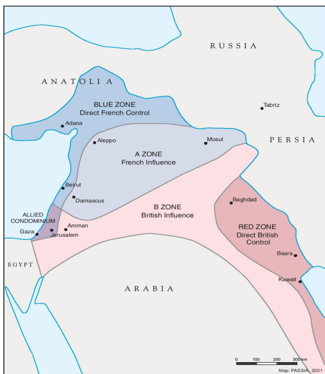
Illustrationskarta till Sykes-Picotavtalet

De franska intressena i Mellanöstern under denna tid är inte lika enkelt att beskriva som när det gäller förståelsen av de brittiska som hade det geopolitiska intresset att bevara och dominera sambandet mellan moderlandet och den hörnpelare i imperiet som utgjordes av Indien. Frankrike var starkt nog att utgöra en världsomspännande kolonialmakt om än inte riktigt av samma dignitet som den brittiska men hade under större delen av 1700-talet varit den starkare sjömakten av de två. Ambitionen att ha ett stort inflytande även i Mellanöstern låg så att säga i tangentens förlängning av den tidigare koloniala historien.