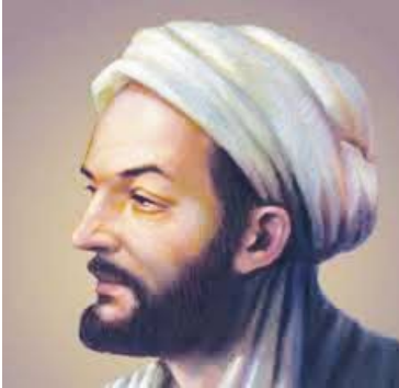
Ibn Sina (Avicenna)

ett universitet med forskning och gav breda utbildningar i arkitektur, ingenjörskonst, läkekonst m m och hade ett mycket omfattande bibliotek. Dess blomstringstid inleddes med kalifen Al-Mamun i början av 800-talet. Visdomens Hus ( Bayt al-Hikma ) förstördes med hela Bagdad 1258 på order av den mongoliske härföraren Hülegü khan , bror till Kublai khan, som vräkte lejonparten av alla böcker i Tigris. Kunskap var redan då ett skarpladdat och farligt vapen. Matematikern och filosofen Nasir al-Din al-Tusi fick ändå litet tumme med Hülegü och lyckades rädda ca 400 000 texter till ett persiskt observatorium.