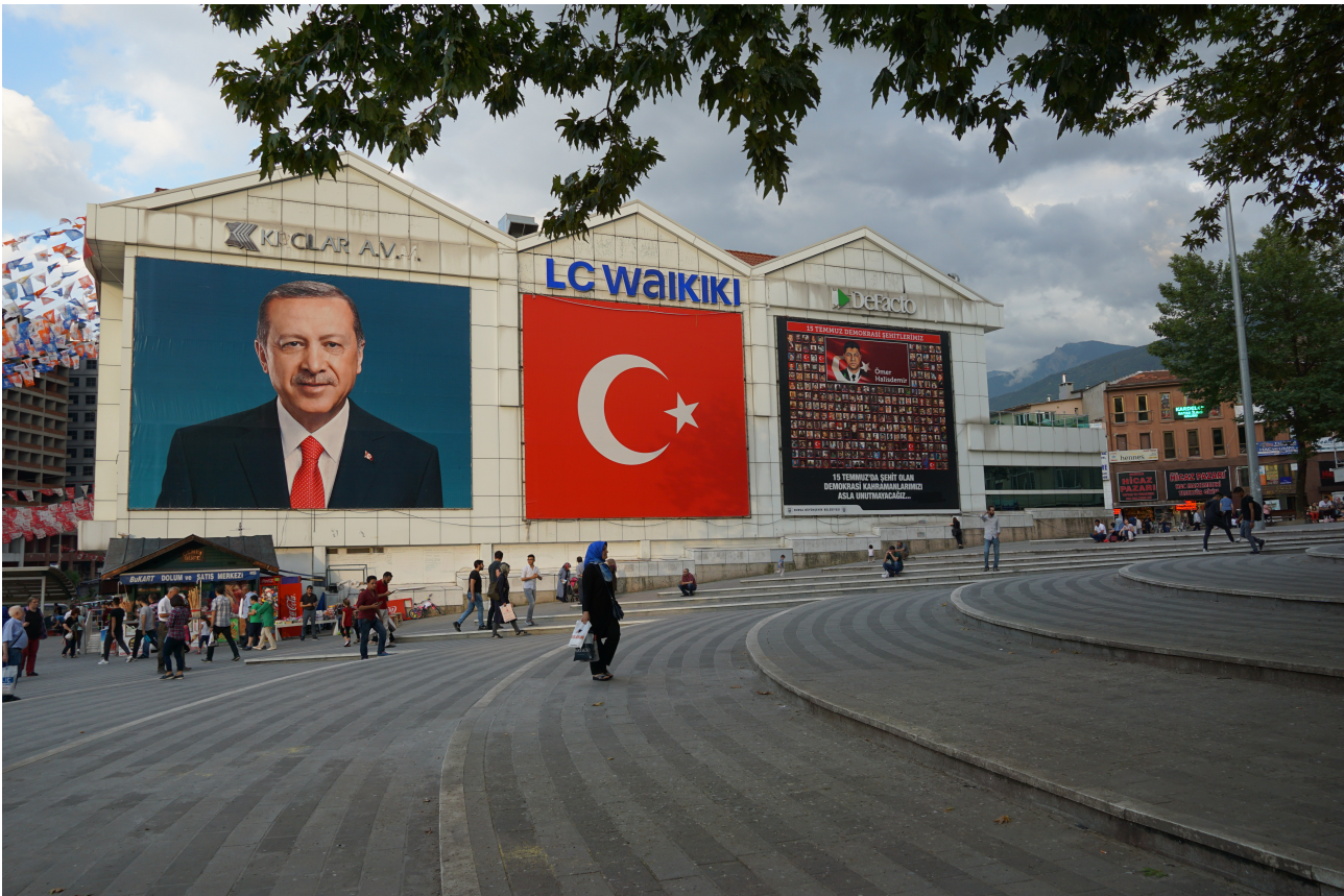
Tayyip Erdogan i valkampanj i Bursa, Turkiet 2015

senare numera är det vanliga begreppet). Osmanerna upprätthöll sitt imperium från 1200-talet fram till sammanbrottet i början av 1920-talet. Här skedde en abrupt förändring från den ålderdomliga osmanska ordningen till en snabb utveckling mot ett sekulärt moderniserat – men auktoritärt – samhälle med Kemal Atatürk som drivande gestalt. De militära styrkorna kom så småningom att få ett starkt grepp om politiken och återkom i maktens centrum med jämna mellanrum nästan in i våra dagar. Lite i taget kom ändå demokratiska institutioner att bli viktigare med parlament valt i fria val, vald president, självständigt rättssystem och fri press. En del av utvecklingen har skett som resultat av krav från EU då Turkiet försökt närma sig ett medlemskap. Tayyip Erdogan och AKP uppnådde via ekonomiska reformer en snabb ekonomisk utveckling från början av 2000-talet och fick ett omfattande stöd i folkopinionen. Den demokratiska utvecklingen har som bekant gått i stå och vänt sedan dess. I och med detta skärptes också striden mellan de kemalitiska sekulära och AKP:s muslimer.